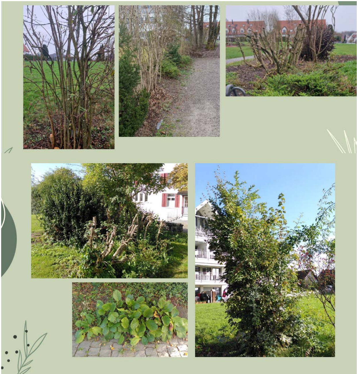
Neophyten bei Kapelle Breite_Aufnahme 2023 Nürens Dorf